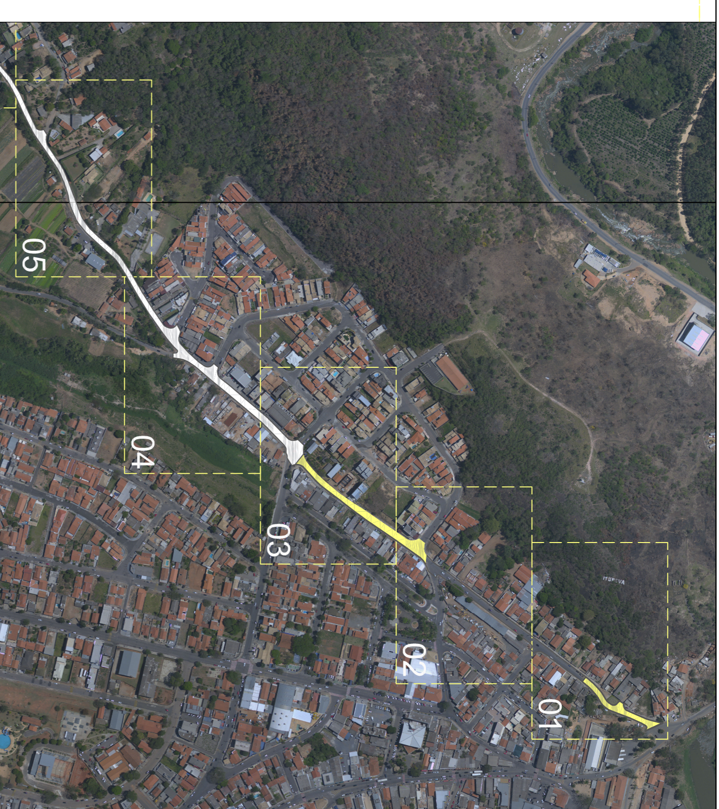
Detalhe - Recapeamento